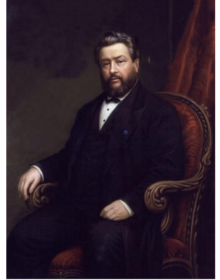
Charles Haddon Spurgeon Alexander Melville'in boyadığı portre.

Hatta İngiliz Müjdecilik üst orta sınıf bir kurum olmaya meylediyordu. Fakat bu "kaba" tarz sayesinde Spurgeon sokaktaki halkla konuşabilmişti. Aslında Spurgeon'un kilisesi "esnaf kilisesi" olarak tanınırdı, fakat eleştiriler yine de çok fazlaydı. Spurgeon sonunda bıkkınlık içinde, "Pek nadiren itibarlı bir Baptist önder bana sahip çıkacaktır" dedi. Fakat kitleler onun vaaz vermesini dinlemeye geldiler.